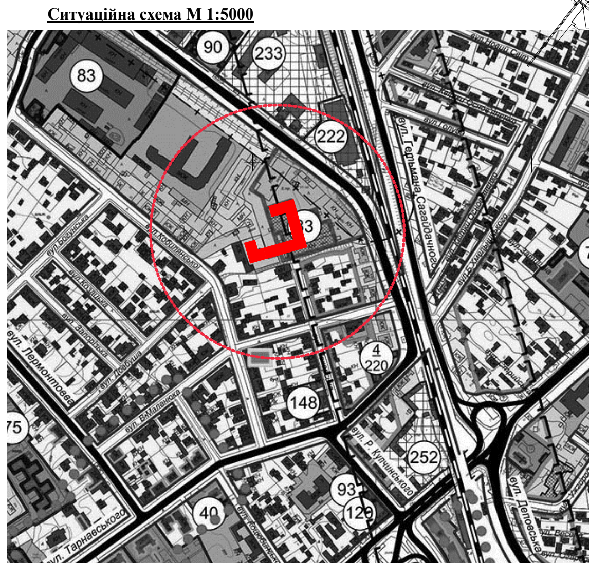
Ситуаційна схема М 1:5000

1. Загальна площа поверху - 1836,83 м.кв. 2. Корисна площа поверху - 1596,01 м.кв. 3. Кількість квартир на поверсі - 28 - однокімнатних - 8 - двокімнатних - 16 - трікімнатних - 4 4. Загальна площа будинку - 16 521,47 м.кв. 5. Корисна площа будинку - 14 364,09 м.кв. 6. Поверховість - 9 поверхів 7. Загальна кількість квартир : - однокімнатних - 64 - двокімнатних - 128 - трікімнатних - 32 - на будинок - 224 8. Орієнтовна кількість гаражів - 74